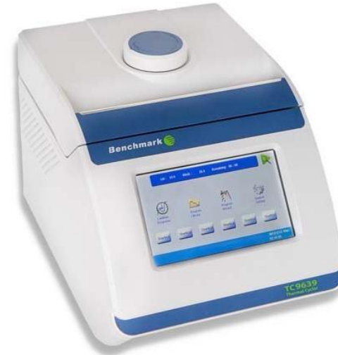
Termociclador T5000-96 Benchmark