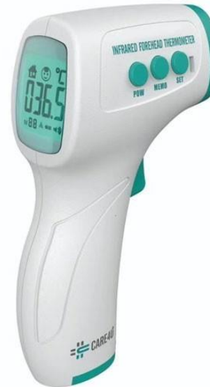
Termómetro Infrarrojo – CARE4U