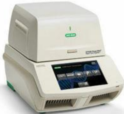
Termociclador para PCR en tiempo real - CFX96 Bio-Rad