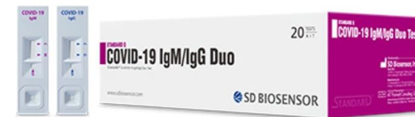
Pruebas de anticuerpo - Biosensor