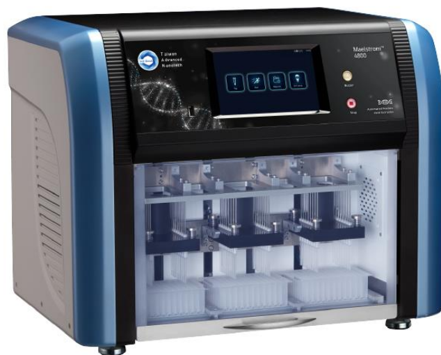
Equipo automático para extracción de ARN para 48 muestras – Maelstrom 4800