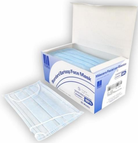
Mascarillas termoselladas de 3 capas, desechables