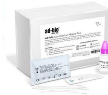
Pruebas de anticuerpo