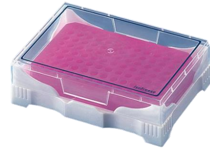
Minirefrigerador para PCR