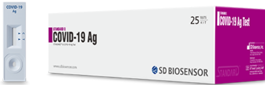
Pruebas de antígeno con hisopado nasofaríngeo - Biosensor