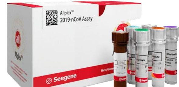
Kit Diagnóstico PCR Covid-19 - Seegene