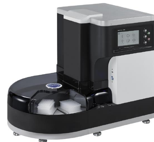
Equipo automático para extracción de ARN para 96 muestras – Maelstrom 9600