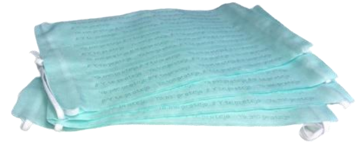
Mascarillas Lavables – Hasta 20 Lavadas