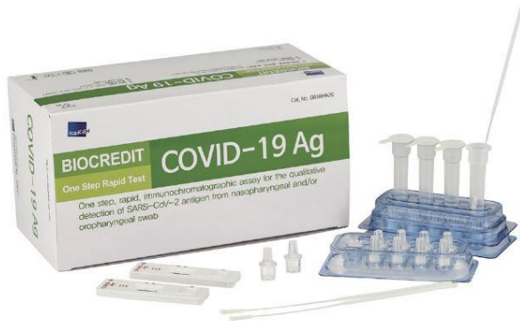
Pruebas de antígeno con hisopado nasofaríngeo - Biocredit