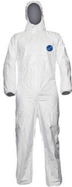
Trajes de protección Tyvek