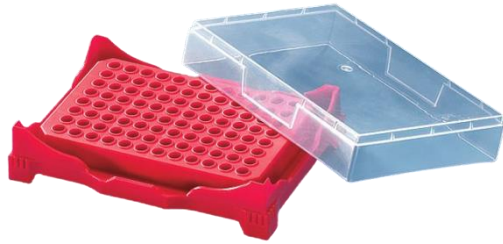
Cajas/Gradillas para tubos de PCR