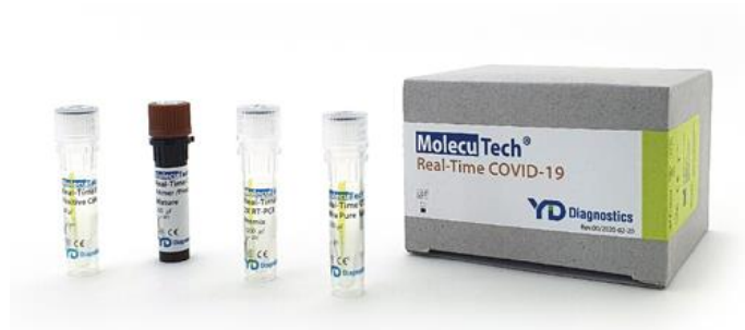
Kit Diagnóstico PCR Covid-19 - Molecutech