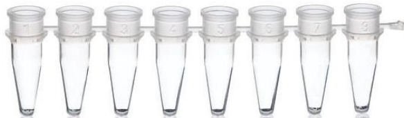
Tiras de tubo para PCR