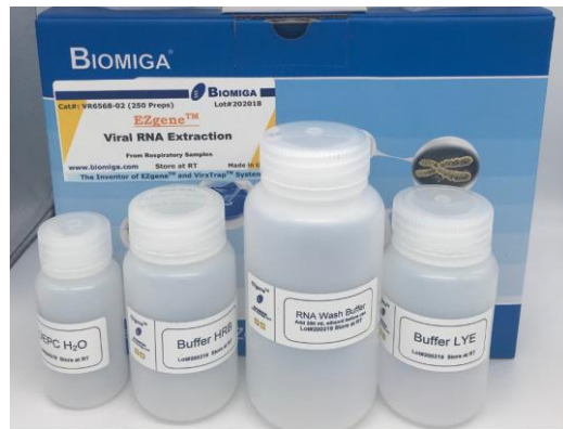
Kit de Extracción ARN Viral - minicolumnas