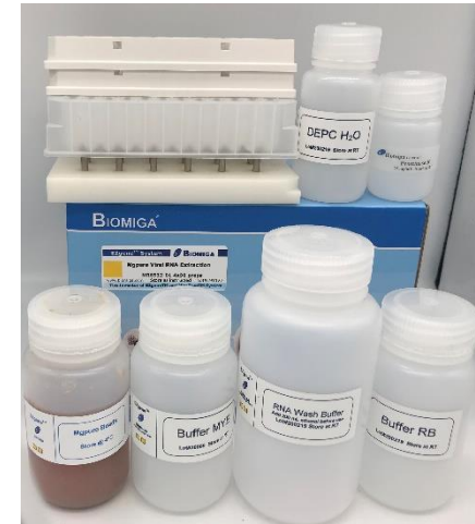
Kit de Extracción ARN Viral - perlas magnéticas