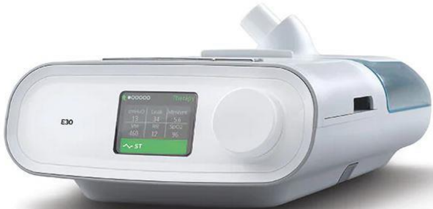
Ventilador Respironics E30 - Philips