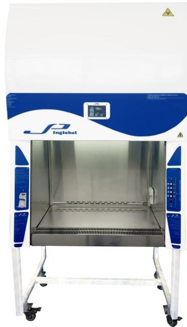
Cabinas de Bioseguridad Clase II