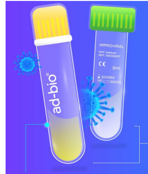
Medios de Transporte Viral