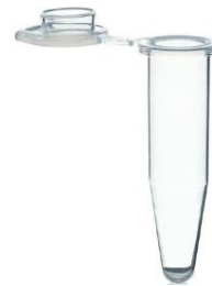
Tubos para Microcentrífuga