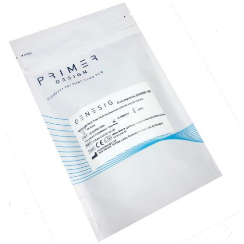
Kit Diagnóstico PCR Covid-19 - Genesig