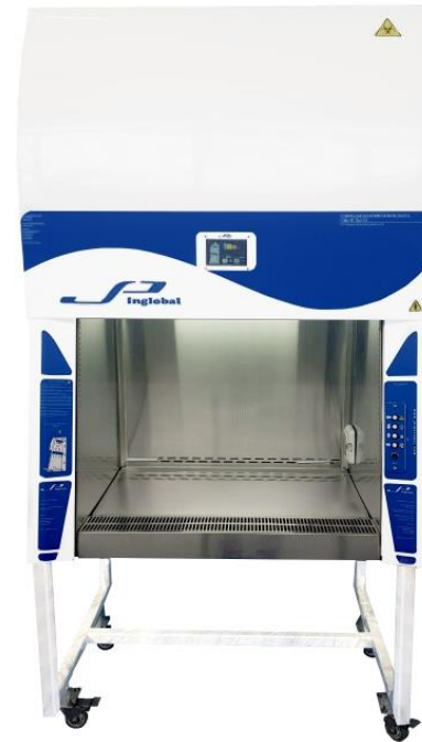
Cabinas para PCR