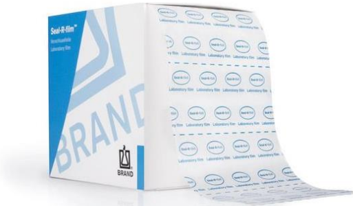
Láminas de sellado