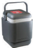
Termos de Transporte