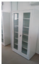
Muebles punto de vacunación